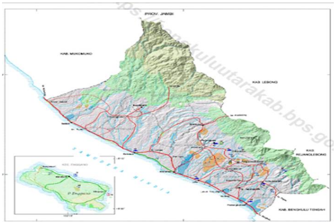
Gambar 1 Peta Wilayah Kabupaten Bengkulu Utara

Kabupaten Bengkulu Utara berbatasan dengan Kabupaten Muko-Muko di sebelah Utara, Kabupaten Bengkulu Tengah di sebelah Selatan, Kabupaten Lebong, Kabupaten Kepahiang dan Provinsi Jambi di sebelah Timur dan di sebelah Barat berbatasan dengan Samudera Indonesia.